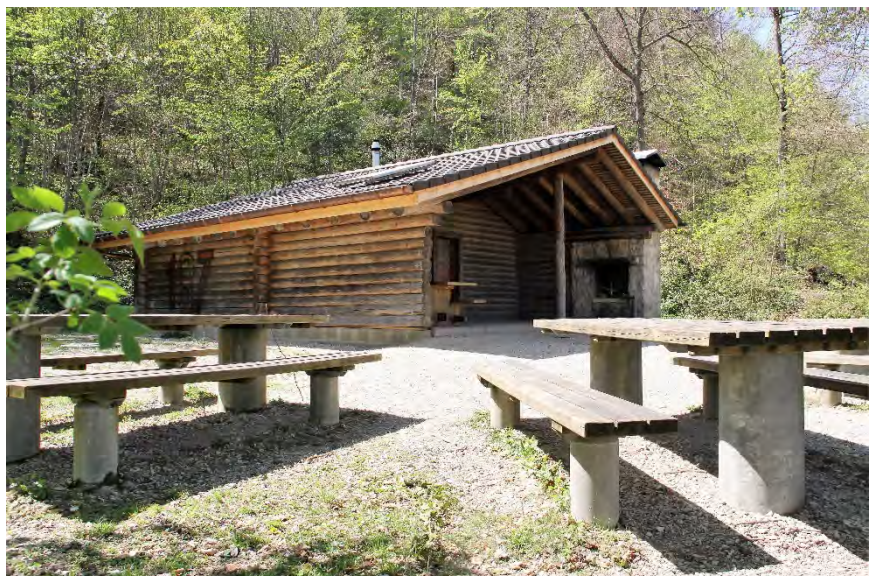
Forsthaus April 2020